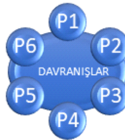
Şekil 1. Psikolojik Sağlamlılık Etkileyen Bireysel Davranışlar

Bu araştırma, çalışanların kısa psikolojik sağlamlılık algılarını ölçmek için amaçlanmıştır. Araştırmada, 6 maddelik ifadelerden oluşan, Smith ve arkadaşları tarafından (2008) geliştirilen Kısa Psikolojik Sağlamlık Ölçeği kullanılmıştır. Her bir madde istatistiksel çalışmada P1, P2, P3, P4, P5, P6 olarak kodlanmıştır. Model oluşturulmadan önce, araştırmaya ait bu 6 maddenin her birisi birey davranışı olarak tanımlanmıştır ve psikolojik sağlamlılı etkileyen davranışlar olarak aşağıdaki şekilde gösterilmiştir.