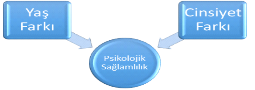
Şekil 2. Araştırmanın Modeli

Araştırmanın modeli Şekil 2’de ki gibi çizilmiştir.